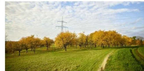
Die 380-kV-Freileitung zwischen den Umspannwerken Pulgar bei Leipzig und Erfurt-Vieselbach

Die erste Konsultation zum Netzentwicklungsplan Strom mit dem Zieljahr 2030 wurde am 28. Februar 2017 abgeschlossen. Die eingegangenen Hinweise wurden durch die vier Übertragungsnetzbetreiber in einen zweiten Entwurf eingearbeitet und am 2. Mai 2017 an die Bundesnetzagentur übergeben, die eine weitere Konsultation der Öffentlichkeit durchführt. Weitere Informationen zur Netzentwicklungsplanung finden Sie unter www.netzentwicklungsplan.de